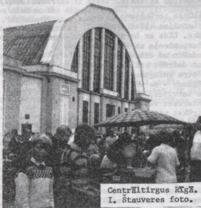
Centrāltirgus Rīgā.

Allocution invitée, prononcée lors du Forum international "La Lettonie dans l'Europe," à Lugano, canton du Tessin, Suisse, le 11 avril 1990.