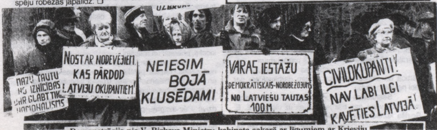
Demonstrācija pie V. Birkava Ministru kabineta sakarā ar līgumiem ar Krieviju