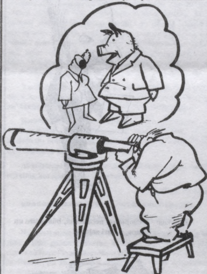
Raksturi atklājas no liela attāluma.