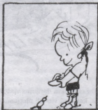
Kas mazākais pašu starpā, tas ir liels - Jēzus kalna sprediķi.