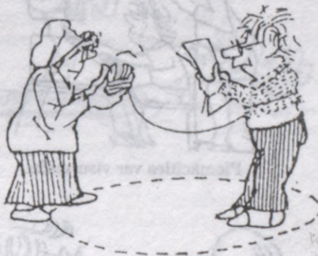
Latvijā ir ap pusotra miljons optimistu, kas redz vairāk kā citi un padara vairāk kā citi