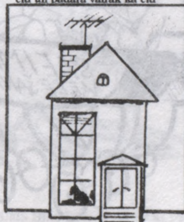
Rakstnieki izvēlās mājas ar lieliem logiem, bet, ja nevar, dzīvo ar kritiķiem bēniņos.