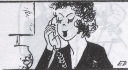
Vasaras paliek isākas

Es, miļā, dodos uz DV salidojumu Anglijā, tad apmeklēju Rīgas teātrus un varbūt tikšu uz operas atklāšanu. Tad man kultūrai pietiks visam gadam.