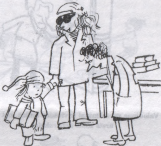
- Viņš man ir lielāks grāmatu lasītājs. Dienās būs gaišreģis.