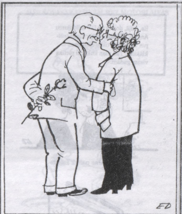
Veca mīlestība nekad nerūs

Pēc Rakstu un mākslas kamera nodibināšanas, kur arī priekšnieks bija J. Druva, Latvijas preses biedrības darbība ap-