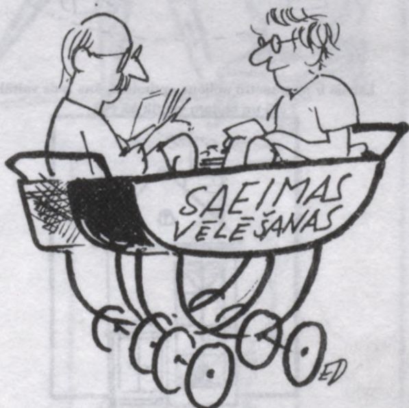
"Man šoreiz tāda sajūta, ka mēs abi šoreiz izkritisim cauri.

sika. Bolševiki 1940. gadā likvidēja preses biedrību un atjaunoja rakstnieku un žurnālistu arodbiedrību, bet pēc Latvijas inkorporācijas nodibināja LPRS rakstnieku savienību ar A. Upīti kā priekšsēdi un Siguldas pili nodeva partijas viru rīcībā. Vācu okupācijas laikā to pārņēma armijas iestādes, bet krievu laikā slepenā dienesta skola (Daļēji pēc A. Švābes Latvju enciklopēdijas 21. burtnīcas).