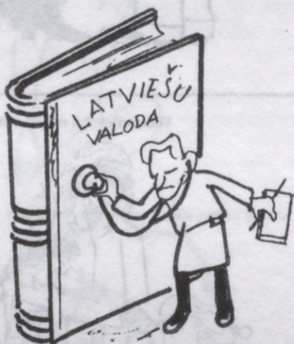
Valodīpas vecmāmiņai ir visādas kaites, bet neviens ārsts zāles neparaksta.