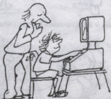
Piemācīties var visu mūžu.