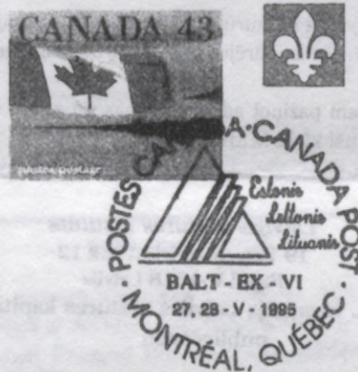
Montrealas Baltiešu pastmarku kluba VI izstādes aploksne