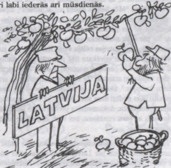
UZ IEDOMĀTAS ROBEŽAS - Kas manā pusē, tas mans!