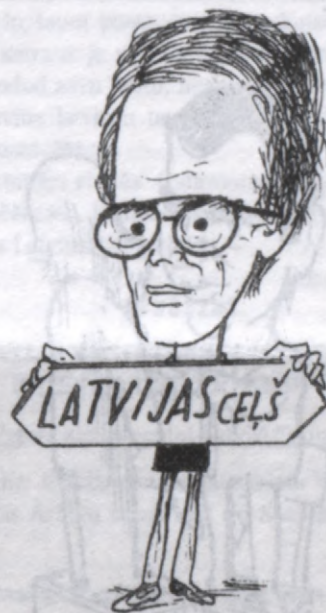
Atkārtoti ieceltais ārlietu ministrs Valdis Birkavs ir arī Latvijas ceļš priekšsēdētājs.

- Senči ar šķēpu sāka un padzina ienaidnieku. Vajadzība vai nevajadzība, esi senču formā.