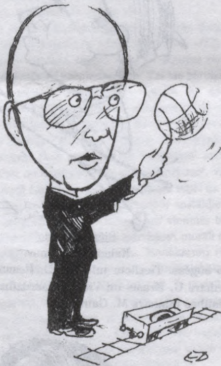
Satiksmes ministrs V. Kristopans - Vai jūs varat iemest bumbu tādā grozā ar vienu pirkstu?

pasaules. Un ja domstarpību gadījumā viņu starpā izceltos karš, - tas tak būtu neredzēts un nedzirdēts jampadricis.