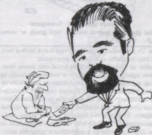
Labklājības ministrs V. Makarovs.

No augšas: Tieslietu ministrs D. Rasnačs, Ekonomijas ministrs G. Krasts un Vides aizsardzības un reģionālās attīstības ministrs M. Gailis.