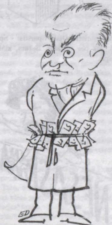
Finanču ministrs Aivars Guntis Kreituss garantē - pie mums nauda nezūd!