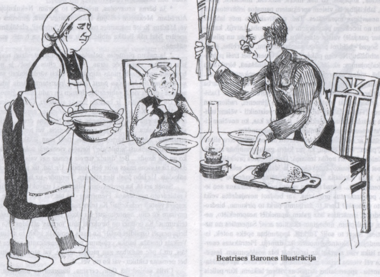
Beatrices Barones ilustrācija

Es galīgi apstulbstu un murminu: - Kāda tur parole... Mari-nēts zalpēteri, kreicnagliņās, cukurā, vircēs, kūpināts kadiķu krūmos... Cik reižu viņš man nav to stāstījis, goda - Dieva vārds.