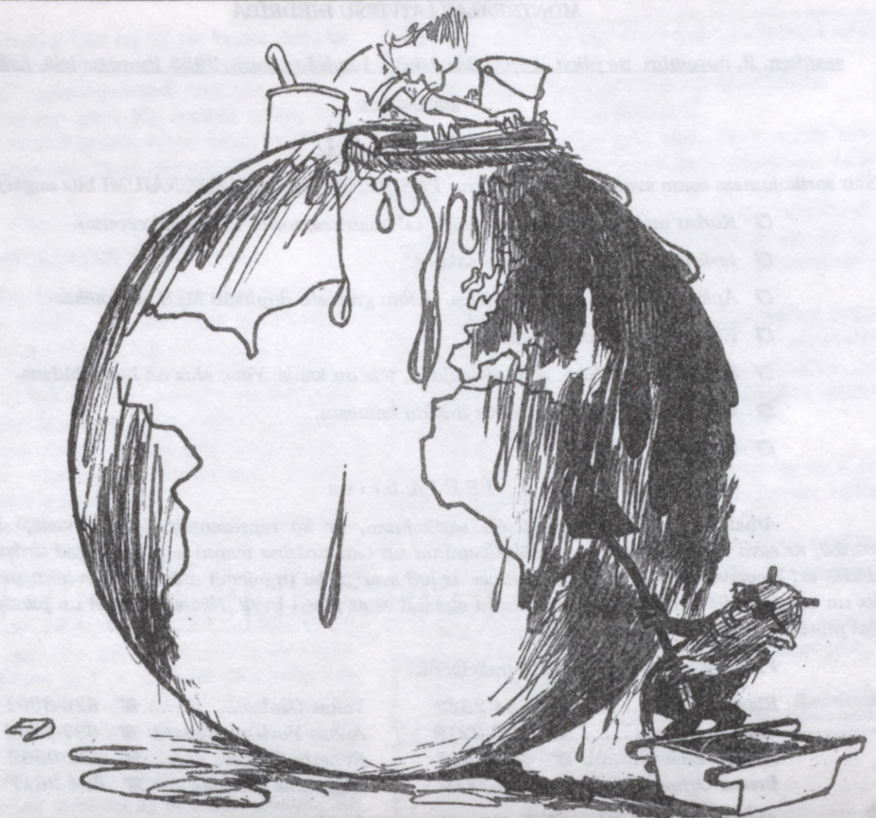
Jo vairāk mazgā, jo ātrāk paliek netīrs