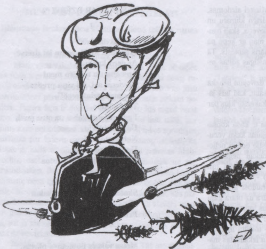
Latviešu bankai šogad eglišu netrūks, un turklāt par puscenu

ciešus sakarus ar Krievijas politisko organizāciju "Trudovoja Rossija", kas pat Krievijā ir atzīta par galēji ekstrēmistisku. No mazākām grupām pastāv vēl "Krievijas Nacionālbolševiku partijas" - NBP - atbalsta grupa, "Latvijas Jaunatnes klubs" - LJK, kas ir "Latvijas komunistu Savienības šūniņa" - LKOS un "Krievijas Liberaldemokrātiskās Domes partija" - KLDP, kuŗu vada Anatolijs Bogolovskis un kas ir Vladimira Žirinovska piekritēji un sakaru uzturētāji ar žirinevskiešiem Krievijā. Pēc Drošības policijas ziņām, visām šīm mazām grupām dalībnieku skaits svārstās ap desmit.