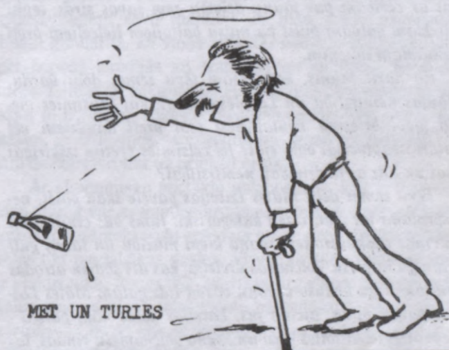
MET UN TURIES