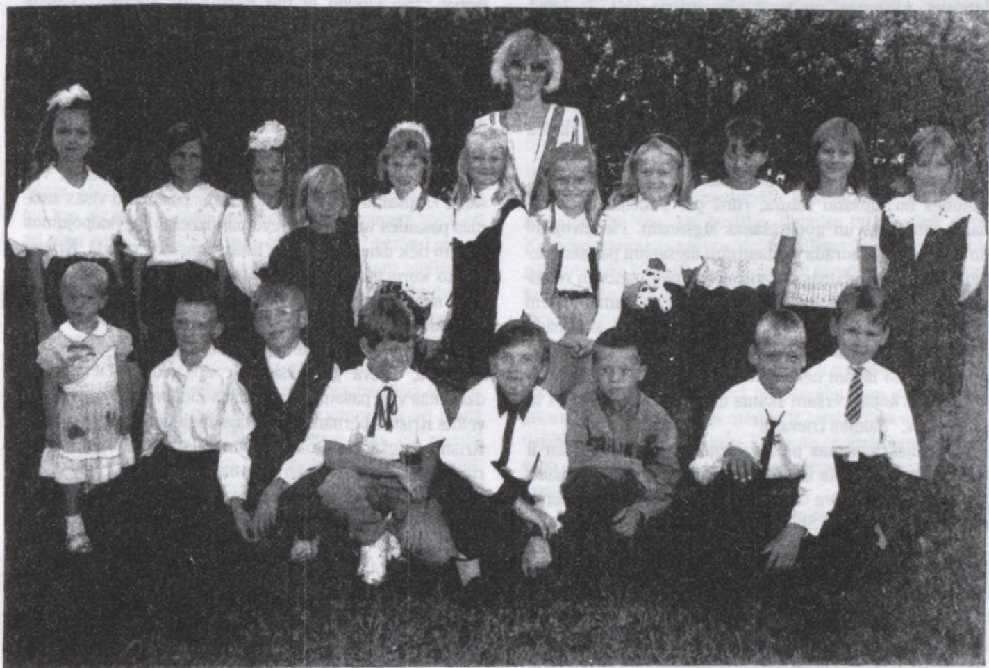
Talsu rajona Lībagu sākumskolas bērni

Šīs sezonas budžets sastādījās no Latviešu fonda piešķiruma - US $ 3.000.- un Kan. $ 2,200.- privātiem ziedojumiem caur LNOP. Ar to varēja sagādāt 1342 brīvbiļetes, caurmērā izmaksājot Ls 1,90 uz katru apmeklētāju. Jāpiezīmē, ka meiteņu un zēnu proporcija ir pārsteidzoša - 4:1.