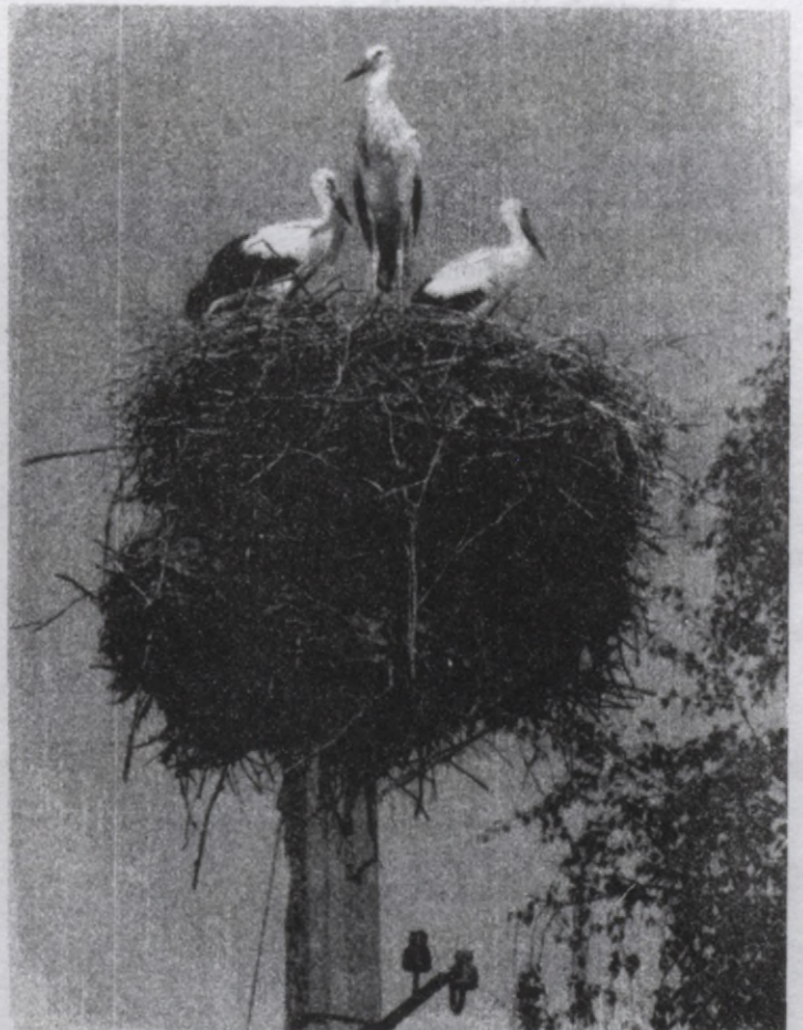
A stork nest in Southern Estonia