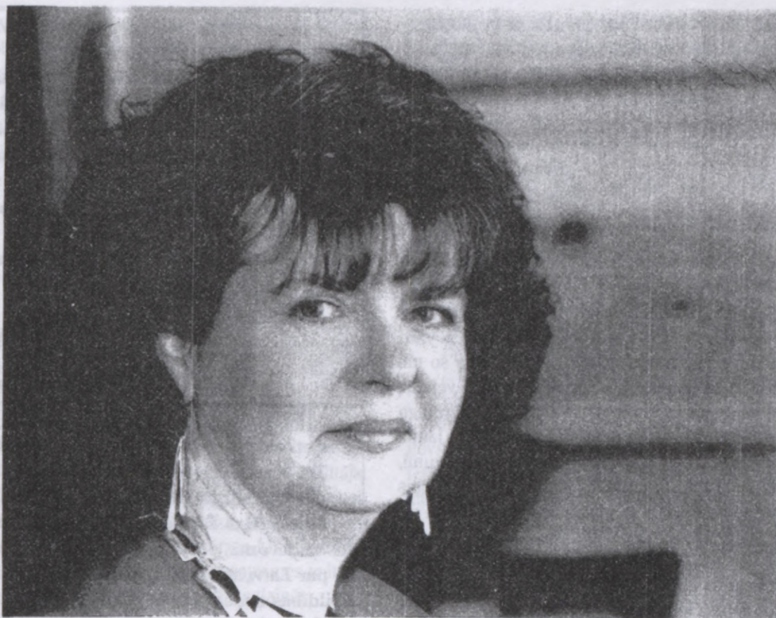
Valsts prezidente Vaira Viķe-Freiberga

Vaira Viķe-Freiberga dzimusi 1937. gada 1. decembrī, Rīgā, pamatizglītību ieguvusi latviešu bēgļu nometnē Libekā, Vācijā, un franču skolā Kasablankā, Marokā. Studijas Kanadā, angļu valodā: bakalaures (1958) un maģistres (1960) grads psiholoģijā no Toronto Universitātes un Phil. Dr. grads (1965) eksperimentālā psiholoģijā no Makgila (McGill) Universitātes Montrealā. Pa starpu darbs kā spāņu valodas tulkotājai, tad kā kliniskai psiholoģei Toronto psihiatriskā slimnīcā (1960-1961). Prot latviešu, franču, angļu, vācu un spāņu valodas. No 1965. līdz 1998. gadam psiholoģijas profesore Montrealas Universitātē (Universite de Montreal, kur mācības franču valodā). Pasniegto kursu temati: psihofarmakoloģija, psiholingvistika, zinātnes teorija un eksperimentālā metode. Pētījumu temati psiholoģijā par atmiņas, valodas un prāta procesiem, ieskaitot drogu ietekmi, bet visvairāk darbu par latvju dainām, to poētiku un struktūru. Kopš 1998. gada 1. jūnija profesore emerita, kopš 1998. g. 19. oktobra Latvijas Institūta direktore. Kanadas Zinātņu akadēmijas (Royal Society of Canada) franču valodas nozares prezidente. Latviešu sabiedrībā darbojusies kopš 1957. gada kā jaunatnes audzinātāja un folkloras speciāliste, arī kā sabiedriskā runātāja un domātāja par latviskās identitātes un tautas izdzīvošanas jautājumiem. Triju zvaigžņu ordeņa virsniece (1995). Korp! Spīdola filistre.