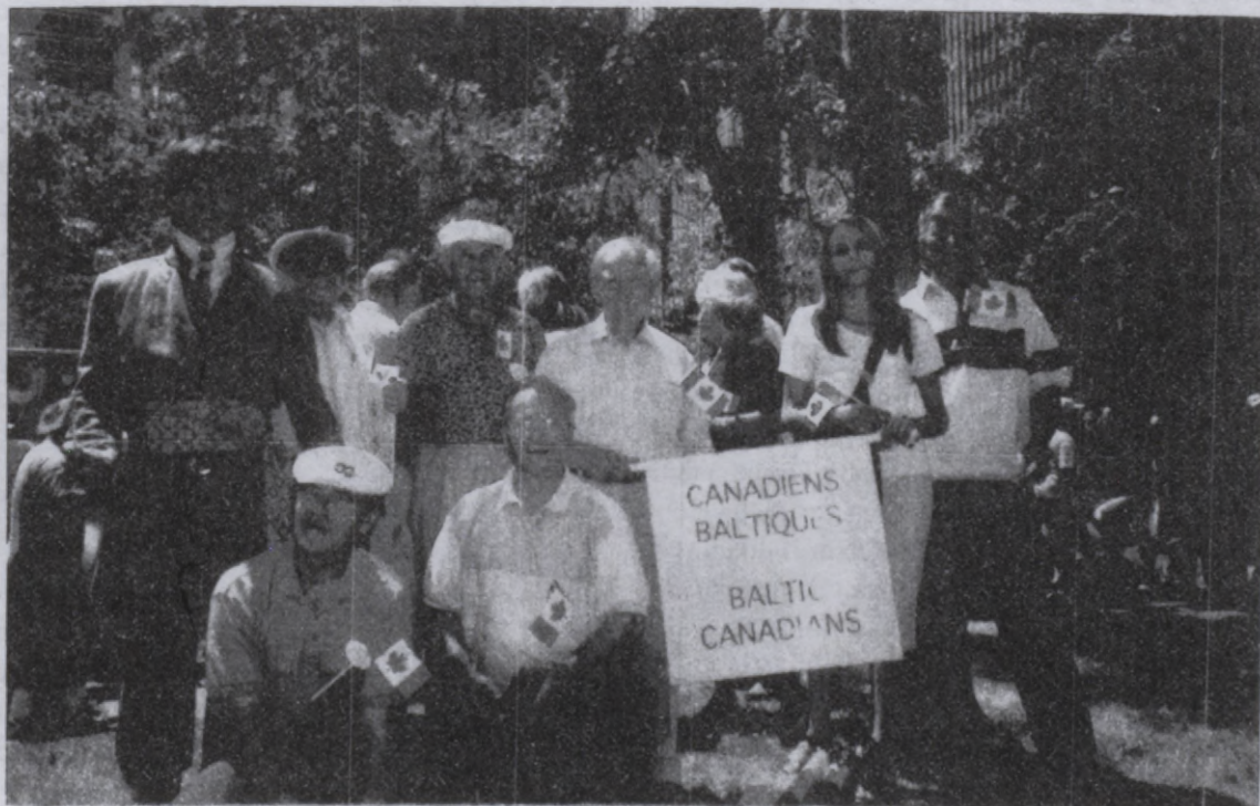
Baltiešu grupa Kanādas dienas parādē 1. jūlijā, Montrealā

Laipni lūdzam visus sarīkojumu rīkotājus - draudzes un organizācijas iesniegt ziņas Sabiedriskās dzīves LAIKRĀDIM rakstiski. Tāpat arī visus paziņojumu un pateicību tekstus. Lūdzam rakstīt uz pilnas loksnes. Ja Jums ir iespējams paziņojumu tekstu sagatavot iespēšanas kārtībā, būsīm par to pateicīgi. Lūdzam šādus tekstus nesalocīt, jo locījums varētu tos sabojāt. Rakstos lūdzam ievērot dubultrindu atstarpi.