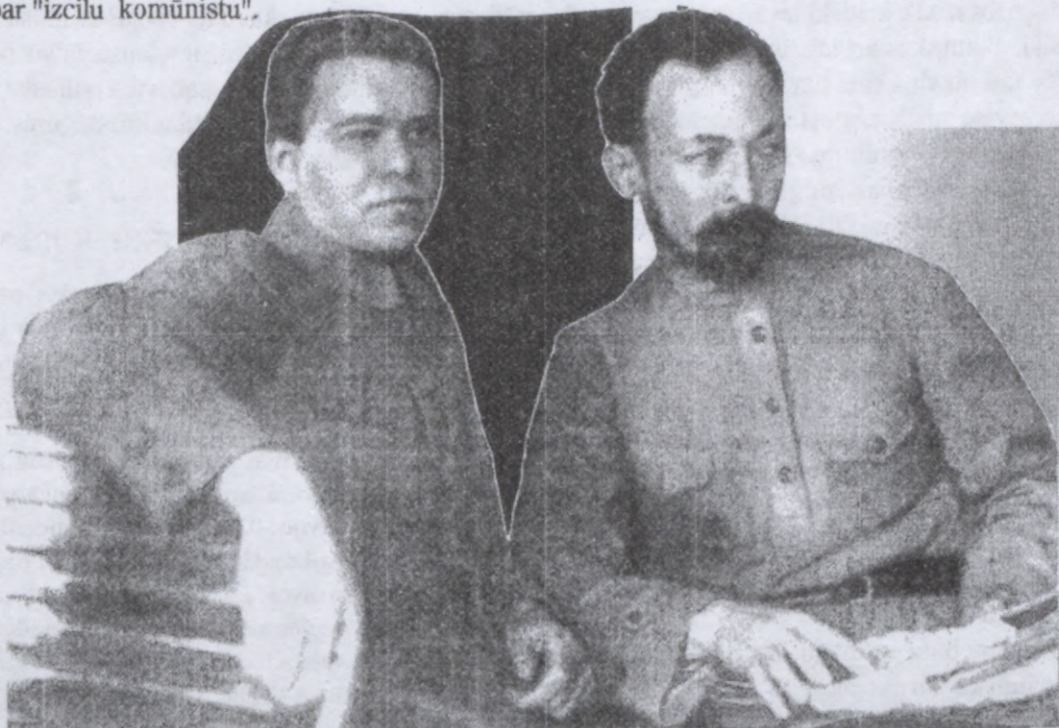
Jēkabs Peterss (no kreisās) un Felikss Dzeržinskis.