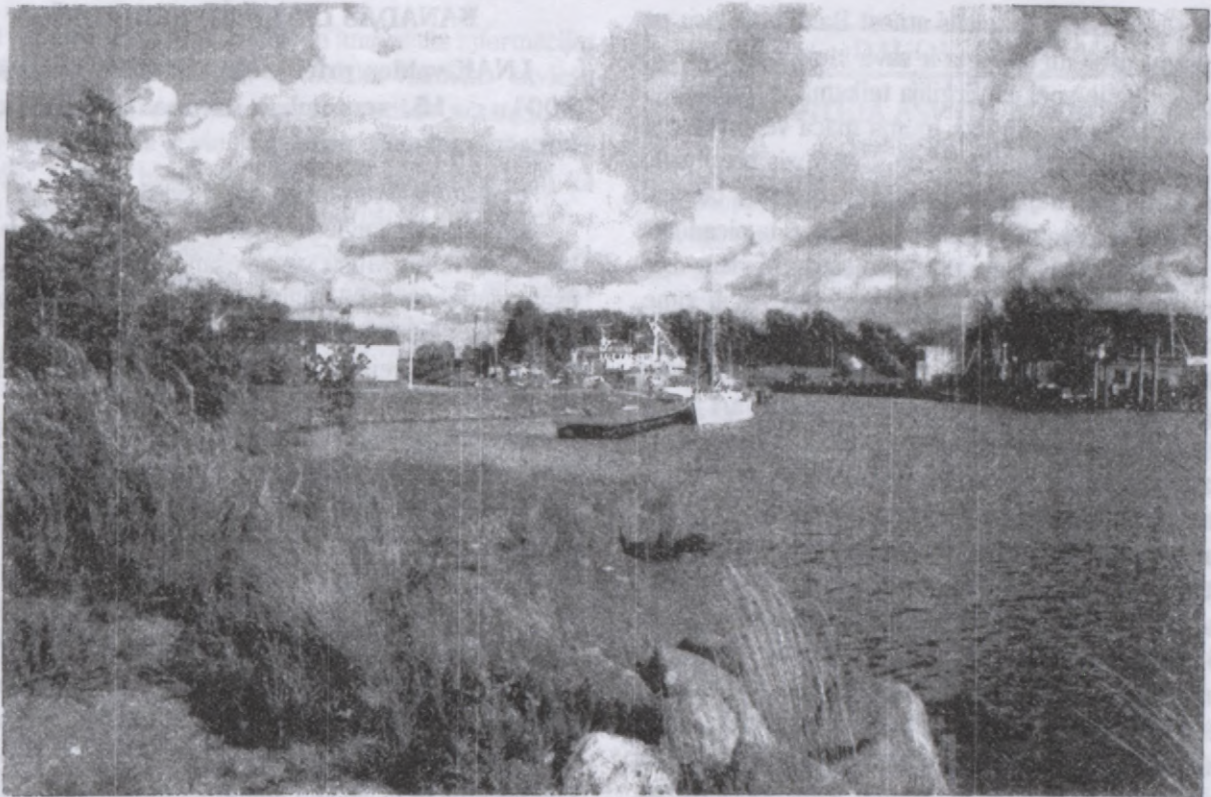
Pāvilosta Kurzemes krastmalā

dodas uz rietumiem un dibina Romu. Viņš nerunā par latīņu brutālo uzbrukumu etruskiem, kultūrai, kas savu zemkopību nostiprināja, pārvēršot Lombardijas purvus par auglīgām druvām, bet par kultūras ienešanu no Trojas, kas pieļāvusi, istenībā pavēlējusi pakļaut etrusku zemkopju kultūru Romas imperijas varas kultūrai.