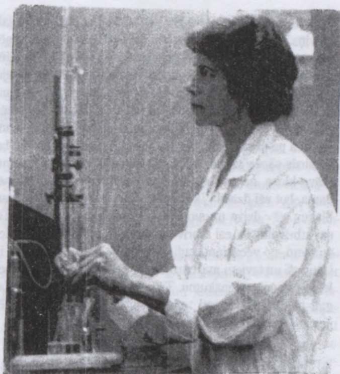
Ar pazemību, bet nepadevību pamazām iekāpoju sev pozīciju vīriešu pārvaldītajā darba laukā (1959 CN Technical Research Lab.)

Kanadā piecos gados no fabrikas strādnieces biju kļuvusi par zinātnieci. Es biju mainījusies. Gadiem ejot, kopā ar darba pieredzi un skolā gūtajām zināšanām bija nobriedis mans bērnišķīgi naivais raksturs. Es biju pieaugusi, kā garīgi, tā miesīgi. Biju kļuvusi gudrāka, pašapzinīgāka un drošāka. Manā jaunībā negāja viegli sievietei, kas bija uzdrošinājusies skatīties zinātnes grāmatās. Jo augstāk sieviete kāpa pa izglītības kāpnēm, jo grūtāk tai nācās atrast vietu, kur nostāties. Nekur, ne valdības iestādēs, ne privāto industriju nozarēs viņa netika pienācīgi novērtēta, ne arī atalgota. Vienkārši, jaunu un precējušos sievieti, kur nu vēl zinātnieci, neviens negribēja! Es nebaidījos un nepadevos. Darbu meklējot, noglabāju laulības gredzenu kabatā - tas dūrās priekšniecībai acīs, un ar pazemību, bet reizē neatlaidību pamazām iekāpoju sev pozīciju vīriešu pārvaldītajā darba laukā.