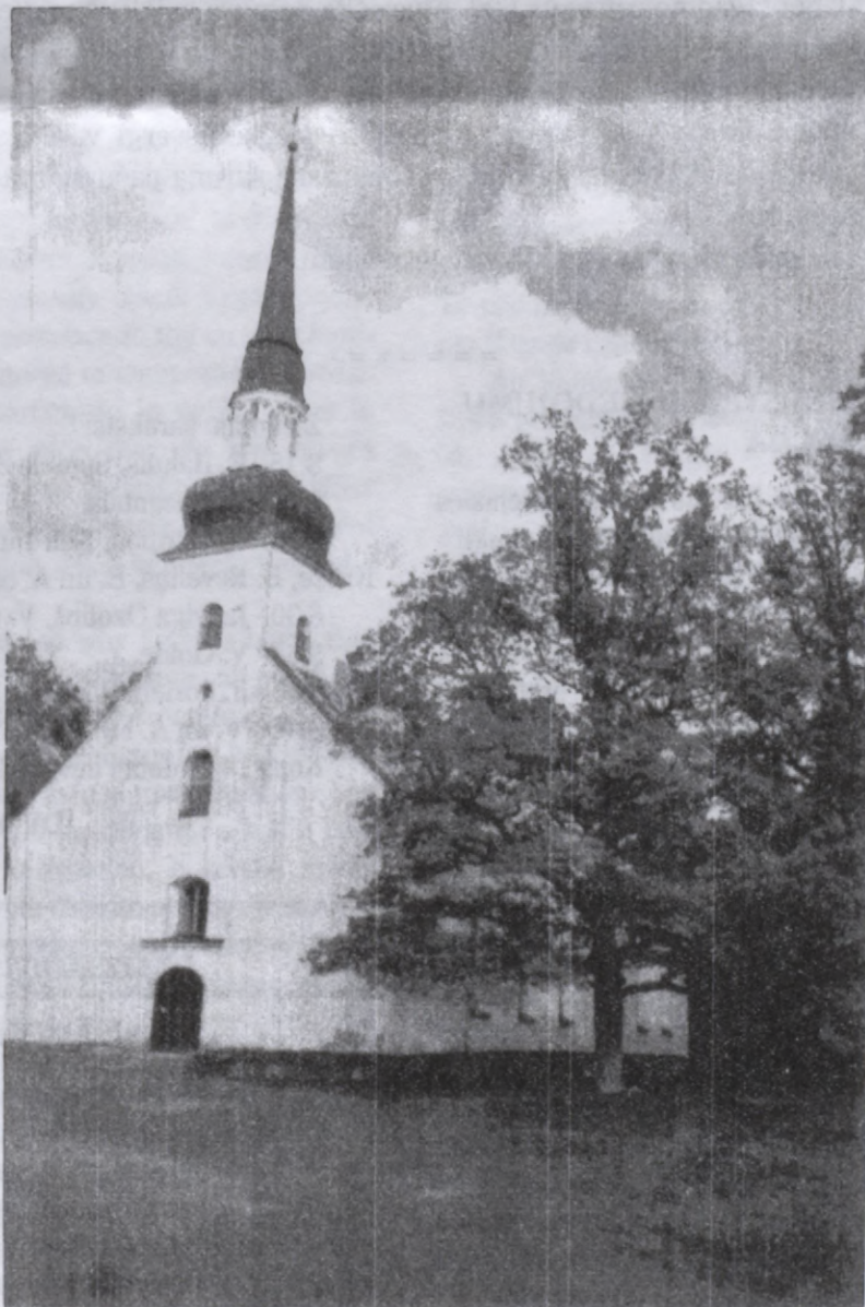
Luterāņu baznīca Rēzeknē

Informācija - lūdzu zvaniet (416) 922-2551, jeb rakstiet Latvian Credit Union, 491 College Street, Toronto, ON M6G 1A5 Kreditsabiedrības birojs slēgts pirmdienās