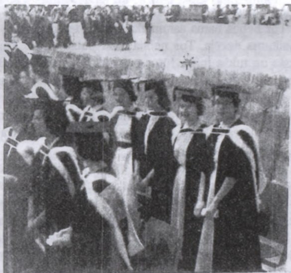
* Saņemot "McGill BSc '55 major in biology" diplomu

Kanadā piecos gados no fabrikas strādnieces biju kļuvusi par zinātnieci. Es biju mainījusies. Gadiem ejot, kopā ar darba pieredzi un skolā gūtajām zināšanām bija nobriedis mans bērnišķīgi naivais raksturs. Es biju pieaugusi, kā garīgi, tā miesīgi. Biju kļuvusi gudrāka, pašapzinīgāka un drošāka. Manā jaunībā negāja viegli sievietei, kas bija uzdrošinājusies skatīties zinātnes grāmatās. Jo augstāk sieviete kāpa pa izglītības kāpnēm, jo grūtāk tai nācās atrast vietu, kur nostāties. Nekur, ne valdības iestādēs, ne privāto industriju nozarēs viņa netika pienācīgi novērtēta, ne arī atalgota. Vienkārši, jaunu un precējušos sievieti, kur nu vēl zinātnieci, neviens negribēja! Es nebaidījos un nepadevos. Darbu meklējot, noglabāju laulības gredzenu kabatā - tas dūrās priekšniecībai acīs, un ar pazemību, bet reizē neatlaidību pamazām iekāpoju sev pozīciju vīriešu pārvaldītajā darba laukā.