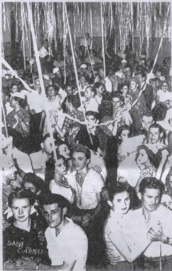
pārstaigā savas jaunības takas, paskaties, ko dara tavs sikais brūnacainais brazīliešu zēns!

nenosluku... Izķepurojos! Ar to vēl dzīvei nepietika. Īsā laikā viņa "aplasīja" visus mana vīra mīļākos radus, tā papēma manu pēdīgo balstu - sērās rasto draudzeni un bez žēlastības atdeva nāvei, lai aizved aizsaulē. Kādreiz varēju lepoties, sacidama: "Jo skarbāka dzīve, jo vairāk belzienu tā dod man pa muguru, jo taisnāka es palieku." Tomēr beidzamie dzīves sitieni bija gandrīz vai nāvīgi. Tie mani ietrieca pa pusei zemē, un tur nu vēl joprojām esmu! Mana sirds sāpēs smeldz, manas brūces asiņo, bet es stāvu. Stāvu klusa, nekustīga, nejutīga, bieži pate sevi neizprasadama, bet vēl dzīva! - Jā... dzīva! Caur asarām redzu - man blakus stāv dzīve un smejas. Dzīve smejas un saka: "Tu esi atbrīvota! Tu esi atbrīvota no vīra un bijušajiem uzdevumiem, no vecākiem, radiem un draugiem. Tavi bērni ir izauguši un taviem mazbērniem tevis nevajag. Tev nav nekādu ģimenes pienākumu. Tu esi brīva un patstāvīga. Tagad tu vari dzīvot pati savu dzīvi, kā tu to kādreiz vēlējies... Vai ne? Vēl jau vaigs tev itin košs. Ej nu,