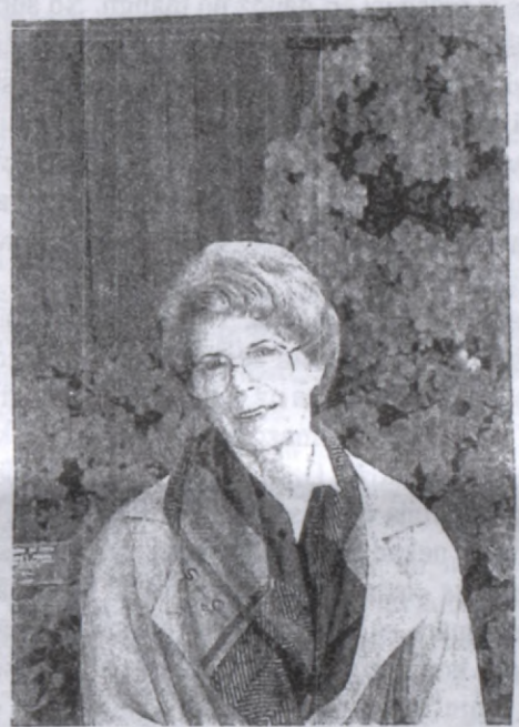
Redzu klusu, kautīgi atturīgu un bailīgi piesardzīgu sievu, stāvam tuvu mūžības vārtiem

Dzīve nekad nestāv dikā. Tā kārto un pārkārto. Tā maina un pārmaina. Tā skolo un pārskolo. Tāda steidzīga un darbīga ir dzīve. Kā mazs bērns, dzīve ir nemierīga un reizēm niķīga. Tā pastāvīgi un neatlaidīgi kaut ko kāro un uzstājīgi prasa. Tāpat kā bērns dzīvē mīl spēlēties - dodot un atkal ņemot.. Tāda kaprīza, reizēm velnišķīgi nežēlīga spēlmane ir dzīve.