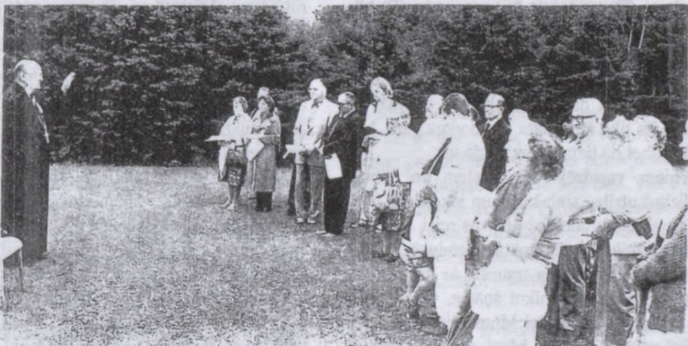
Tas bija viņš - mans vīrs, ko cilvēki agrāk vienmēr meklēja.