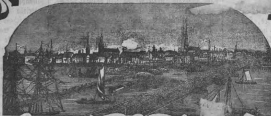
Mahjas weefis isnaht weenreis pa nedetu.

Ar pašā wifufchēliga augsta Reifara weblefchānu.