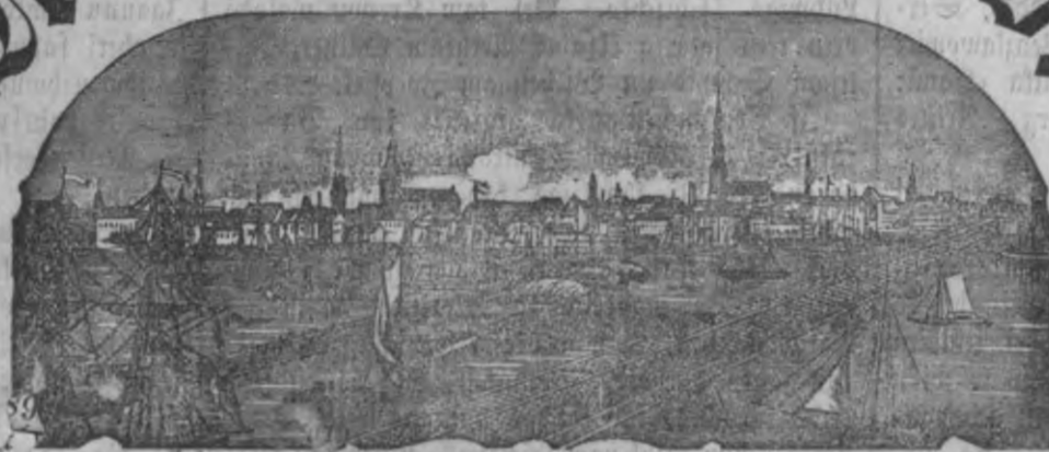
Mahjas weefis isnaht weenreis pa nedetu.

Ar pašā wifuschehliga augsta Keisara wehleshanu.