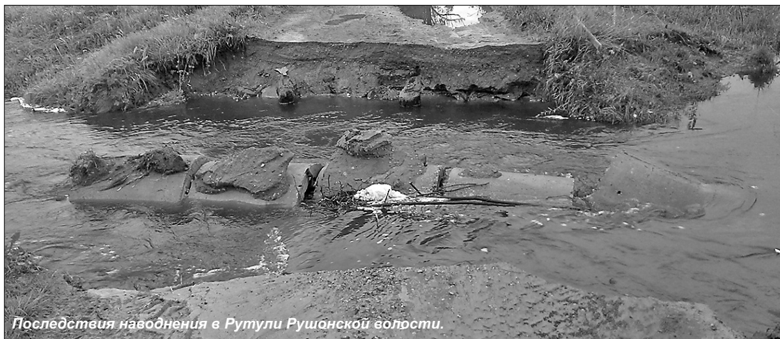
Последствия наводнения в Рутули Рушанской волости.

Дожди в Латгалии, уже названные наводнением столетия, поскольку в короткое время вылилась четвертая часть годовой нормы, нанесли существенные потери как инфраструктуре самоуправления, затопив дороги, так и крестьянам края, поскольку под водой остались зерновые посева и поля.