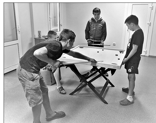
В день презентации проекта активно испробовали новый инвентарь, в том числе, новус.

Проект был поддержан, и на сумму выделенного финансирования приобретены мешки для сидения и пуфы, оборудование для игры в новус, настольные игры, музыкальные танцевальные коврики, говорящая Азбука и комплект кубиков Лего. Подумали обо всех возрастных группах, а в случае необходимости, всё это можно будет использовать на меро-