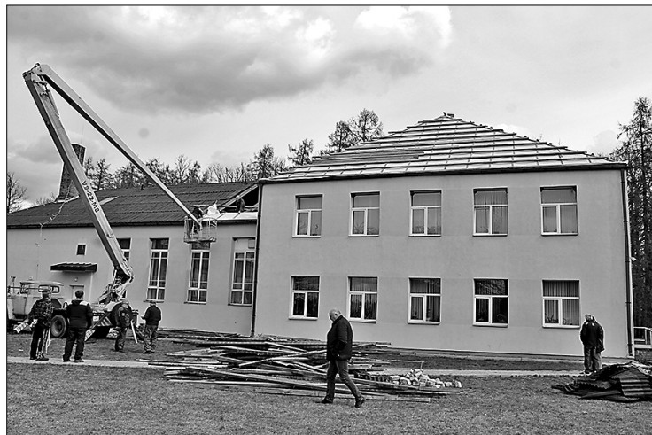
В конце апреля начаты ремонтные работы в здании Гаянского территориального волостного управления и дома культуры.

Для того чтобы учебные заведения были подготовлены к новому учебному году, не только педагоги и технический персонал школ, но и дума Рибебиньского края летом внесла свой значимый вклад в благоустройство учебных учреждений, финансируя ремонтные работы.