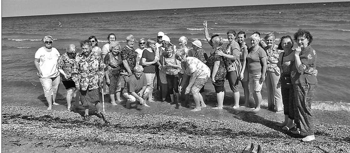
Сеньоры не упустили возможности прогуляться к морю.

В первой декаде августа вместе с настоящей летней погодой участники Риебиньского и Силокалнского общества сеньоров отправились в путешествие, первой остановкой которого стал Саласпилский ботанический сад, давший душевное удовлетворение и наслаждение красотой природы.