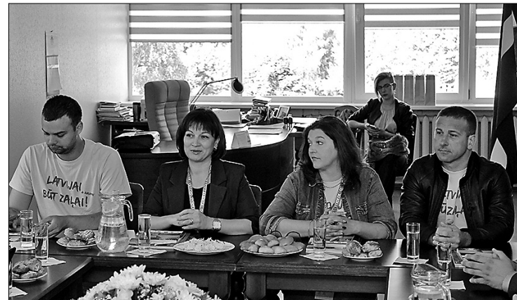
Делегация Молдовы включилась в дискуссию о необходимости укрепления сотрудничества самоуправлений, реализуя различные проекты.