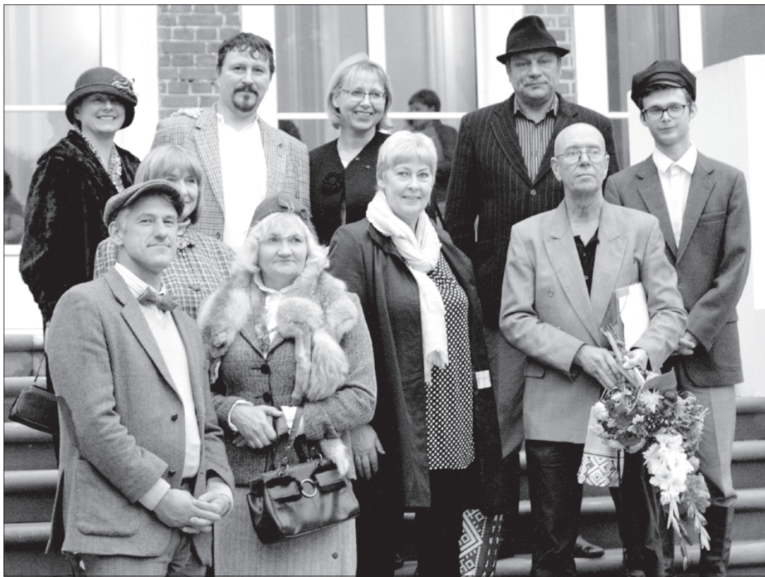
Piltenes amatierteātra aktieri jaunā ampluā.