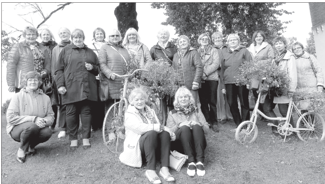
Biedrības "Spārni" ceļotājas viesojas Priekulē.