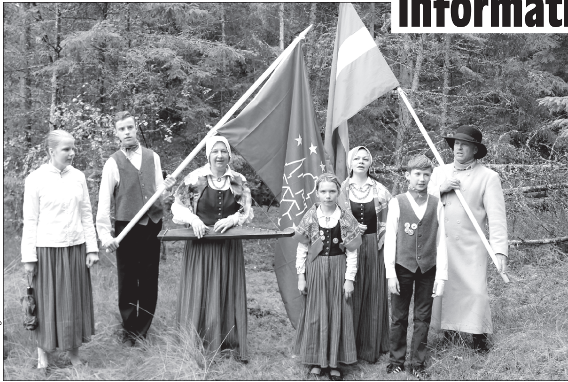
Nabeļkalnu pieskandina folkloras kopas "Kāndla" dziedātāji.

Nabeļkalns atrodas Ventspils novada Tārgales pagastā, bijušās šaursliežu dzelzceļa līnijas posma Lūžņa–Miķeļtorni labajā pusē, "Latvijas Valsts mežu" pārvalditājā īpašumā "Olmaņu mežs". Kalns novietots ap 0,3 km attālumā uz DR no "Vētru" mājām un ap 120 m attālumā uz D no bijušās dzelzceļa līnijas trases. Tas ir savrupi stāvošs kalns, ar ļoti stāvām, aptuveni 10 m augstām malām, kalna virsotne senatnē izraknāta. DA, D un DR pusē