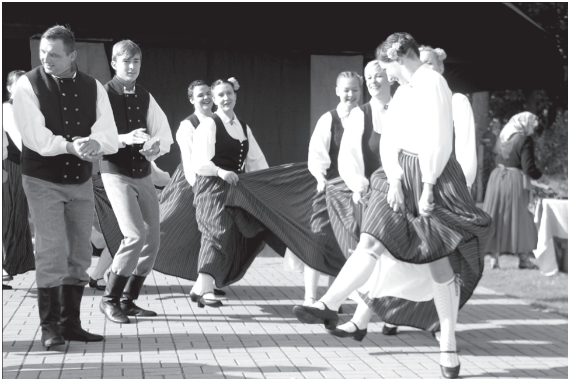
Skatītājiem patika vidējās paaudzes deju kolektīva "Usma" dalībnieku uzstāšanās.

23. septembrī saulīte slidēja pa zemes virsu, sasildot arī tos, kuri pulcējās Ugunsplavā, lai vērotu uzvedumu "Ābols brauc precībās suitu gaumē". Etnogrāfiskajam ansamblim "Maģie suiti" palīdzēja vidējās paaudzes deju kolektīva "Usma" dalībnieki un pūtēju orķestra "Ugāle" muzikanti.