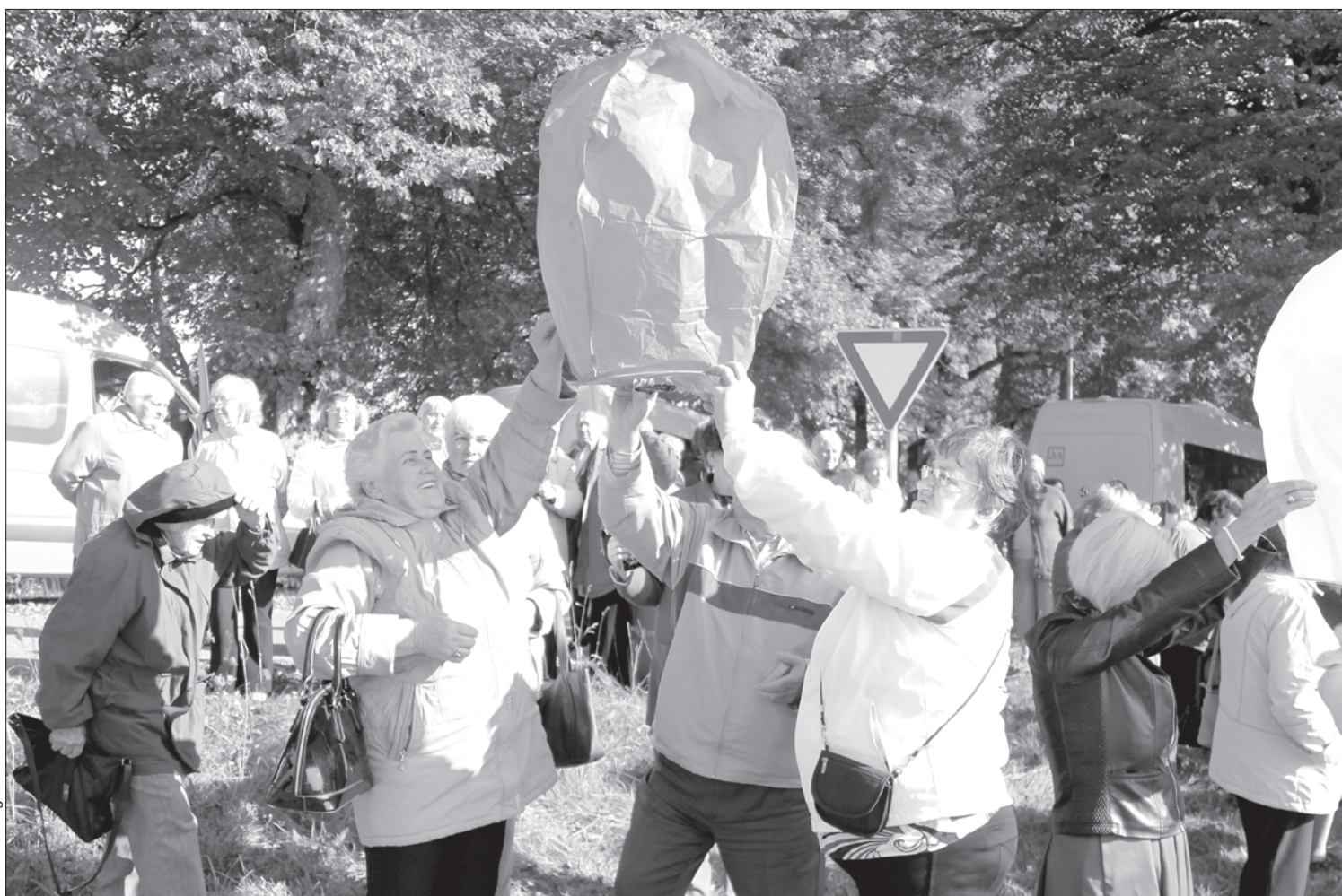
Seniori aizrautīgi darbojas, lai gaisā paceltos papīra laternas. Kad tās jau bija debesis, skanēja skaļas ovācijas.