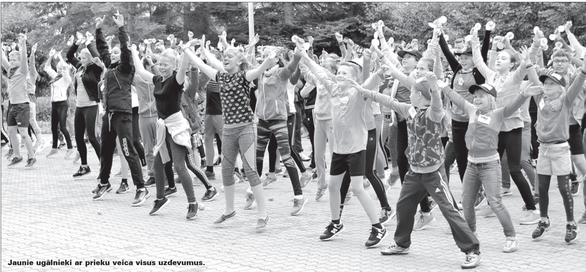
Jaunie ugālnieki ar prieku veica visus uzdevumus.