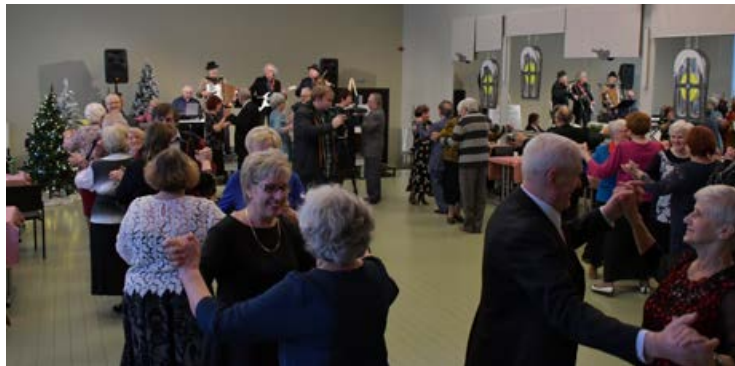
Projekts Nr. 9.2.4.2/16/1/049 „Veselības veicināšanas un slimību profilakses pasākumi Jēkabpilī” tiek īstenots darbības programmas „Izaugsme un nodarbinātība” 9.2.4. specifiskā atbalsta mērķa „Uzlabot pieejamību veselības veicināšanas un slimību profilakses pakalpojumiem, jo īpaši nabadzības un sociālās atstumtības riskam pakļautajiem iedzīvotājiem” 9.2.4.2. pasākuma „Pasākumi vietējās sabiedrības veselības veicināšanai un slimību profilaksei” ietvaros. Projekts tiek finansēts no Eiropas Sociālā fonda un valsts budžeta līdzekļiem.

Pirmais deju cikls tika noslēgts 15. decembrī Krustpils kultūras namā ar deju vakaru jeb senioru deju parādi plašākai senioru auditorijai. Pasākuma laikā pirmā deju no-