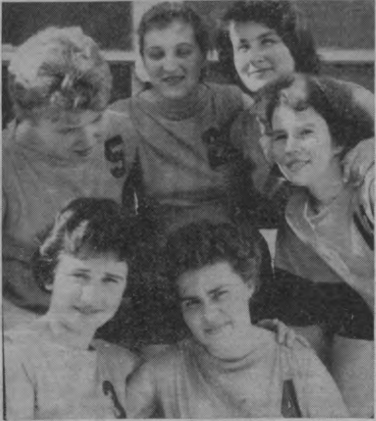
SIDNEJAS SPARA MEITENES