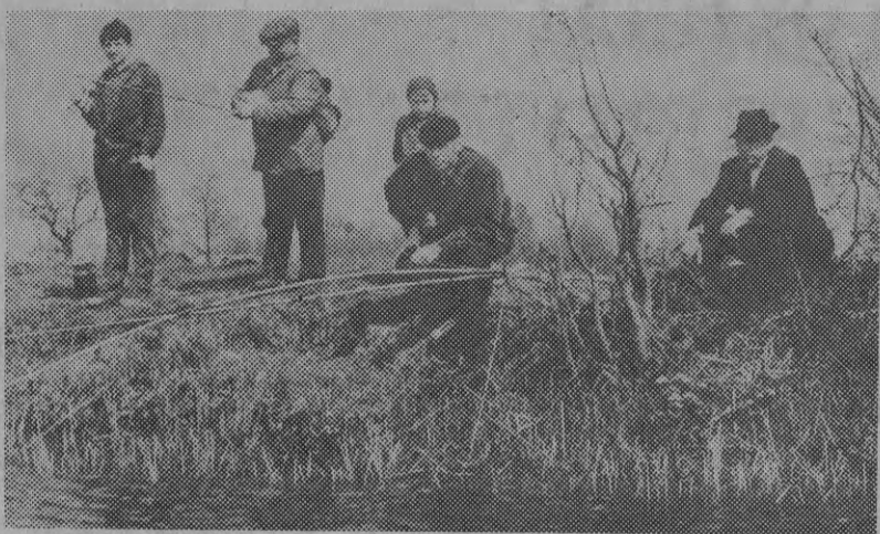
На рыбалке.