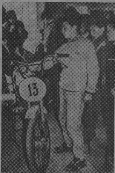
тоже хочет этому научиться? Попробуйте! Нужно только терпение. Н. КЕЗБЕРЕ.