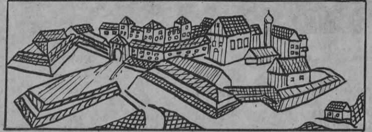
* Митавский замок триста лет тому назад. Можно ли сегодня его осмотреть в Елгаве?

Если ты любознательный человек, то обязательно спросишь: