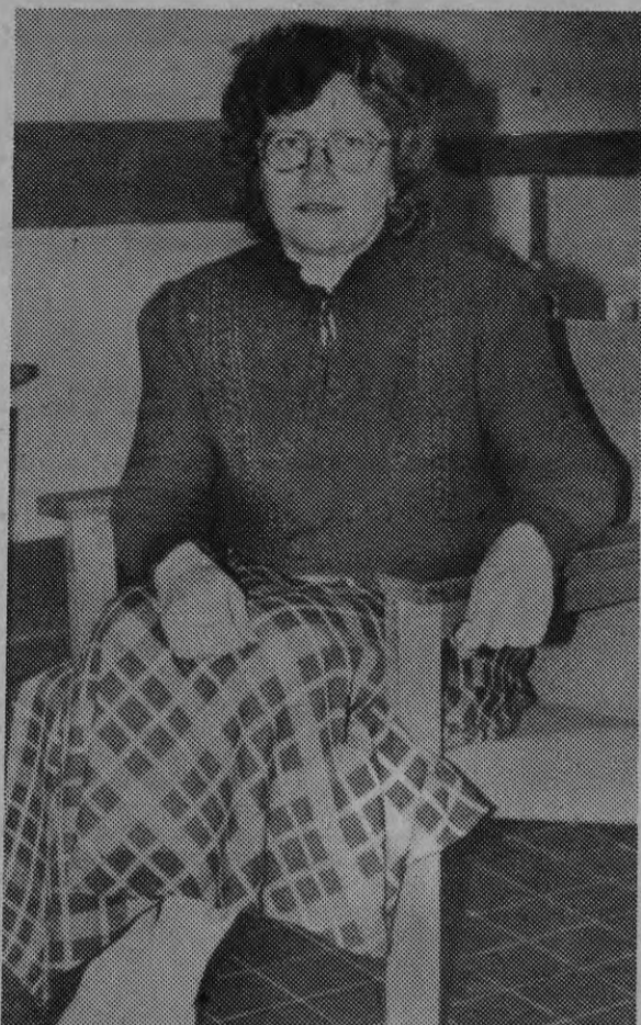
шennie проблем. Вот и на этот раз правление надеется: возможно, кто-то знает о подходящем здании для будущего реабилитационного центра?

«Аура» уже не раз обращалась к читателям газеты. Почти всегда елавачане предлагали помощь, ре-