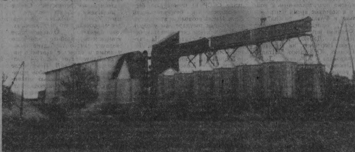
На втором участке агрофирмы «Накотис» заканчивается строительство новой зерносушилки. Основное оборудование завезено из Польши и Германии.