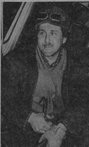
нулся к своим, конечно, немало важно было и то, что в «Оглайне» семья, подрастает сын, которому папа должен уделить внимание. Л. ПАВЛОВА.

Лет семь, восемь назад уходил он работать в соседнее хозяйство, но лишь год пробыл там — вер-