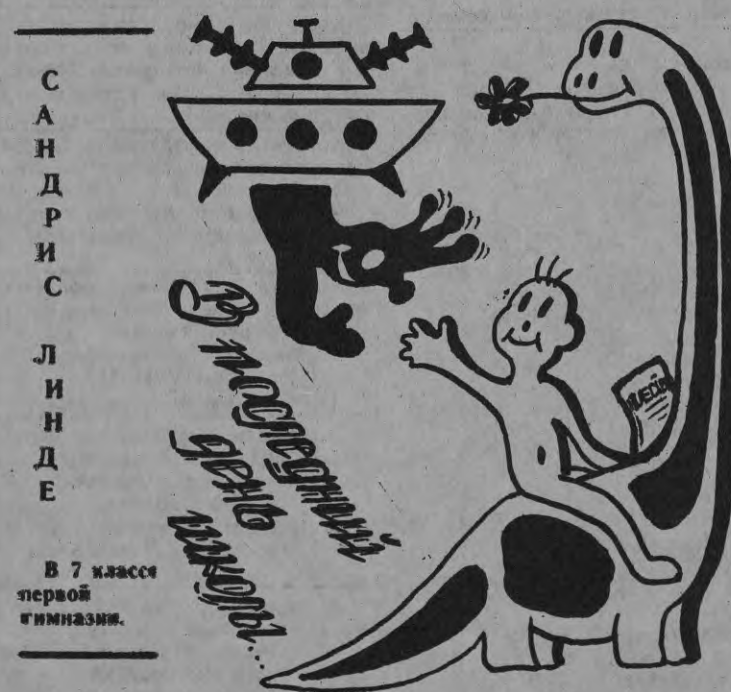
В 7 классе первой гимназии.

Фантазия необходима как в математике, так и в искусстве. Это ни для кого не секрет. В целях сохранения столь нужного умения фантазировать создан Елгавский клуб фантазеров. Здесь вы найдете фантастические сказки своих ровесников, и рисунки, и интересные задачи на сообразительность. Если ты сам рисуешь или пишешь, а может быть, просто фантазируешь, пришли письмо по адресу: Елгава, ул. Видус, 43, «САМ», индекс 229608.