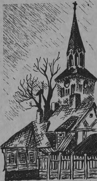
Старая Елгава. Какое из этих зданий сохранилось?

Чтобы узнать это, историки решили заглянуть в архив — туда, где хранятся старинные документы. Если там есть бумажный свиток, в котором написано, что в Елгаве есть особые городские законы, тогда можно было бы определить нужную дату.