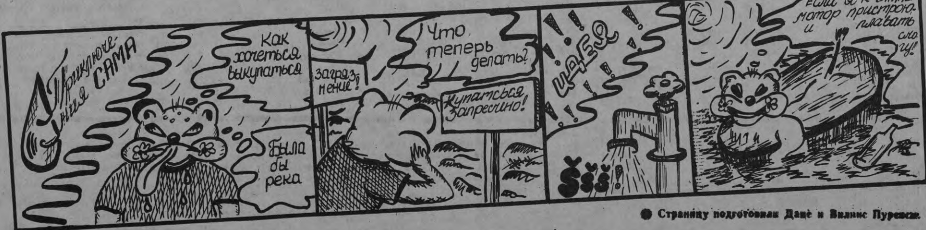
Страницу подготовили Даце и Вилинис Пуресис.

...Иду с табелем в руках мимо канализации. Заглянул туда — там было светло и слышался звон. И тут я преискусился. Нужно было собираться в школу — за табелем.