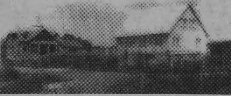
Большое строительство ведется в поселке «Лиезуле» Ценской волости. На снимке: целый квартал новостроек.