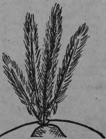
Страницу подготовили Даце и Вилюя ПУРЕНИ.

«Тыньтендзи» развивает ловкость и реакцию.