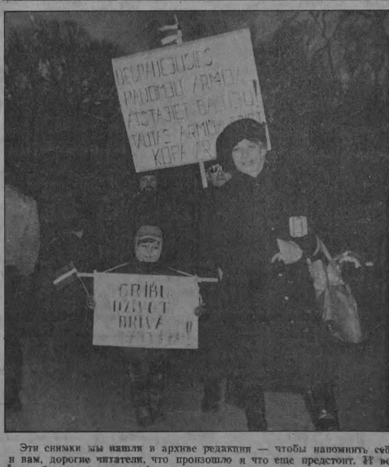
Эти снимки мы нашли в архиве редакции — чтобы напомнить себе и вам, дорогие читатели, что произошло и что еще предстоит. И все — не без участия народофронтовцев.