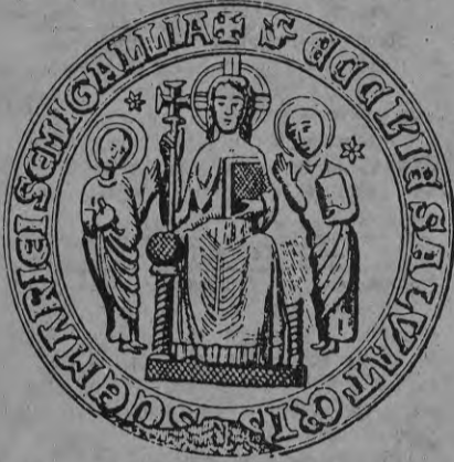
Zemgales doma kapitula simogis no kada 17. sept. 1237. g. Riga rakstilla dokumenta.