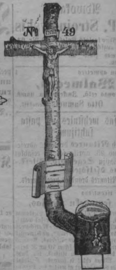
N o 49.