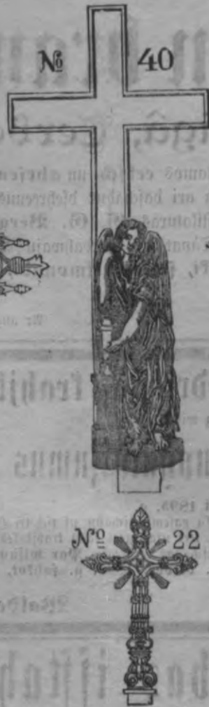
N o 40.