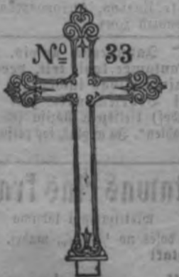
N o 33.

Rigas dšelsleekawas un maschinu fabrikas fabcedriba