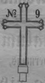
N o 9.

Rigā, Peterburgas Ahrrigā, Terbatas un Dewas celu stubra namā Nr. 21.