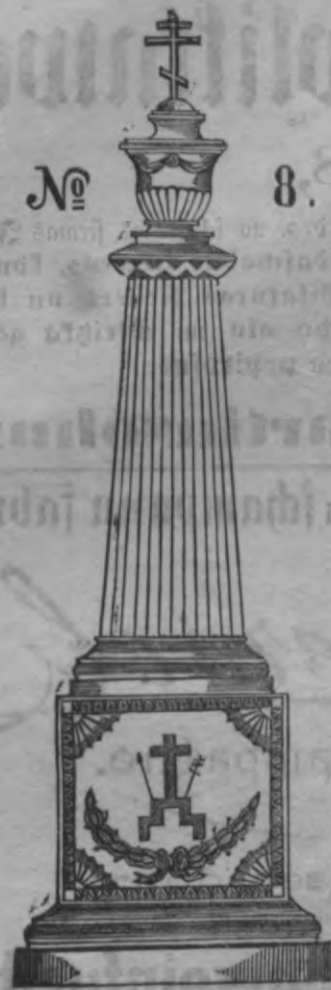
N o 8.