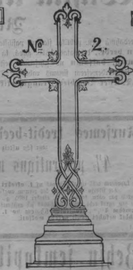
N o 2.