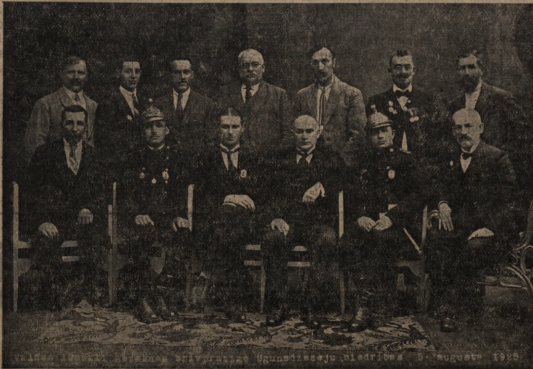
Rēzeknes brīvprātīgo ugunsdzēsēju biedrības valdes locekļi.