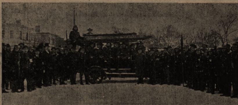
Bišumuižas brīv. ug. b-bas jaunais darba automobils, pēc mēģinājuma pie Muitas dārza 22. nov. 1925. g. Sīkāku aprakstu par jauno automobili un viņa darba spējām sniegsim nākošā numurā.