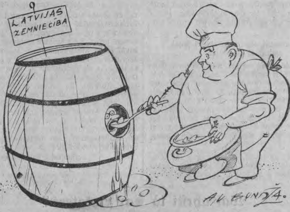
Ullmanis Dīhšāis: „Šahā audšīnāts tu wīstābaf tīkī pašargāts no tenkam par mūhū perionīgeem meitāteem.”

Šarā Ullmana patentē „laufhaimneezības krišes nowehēšjanas šītenū.”