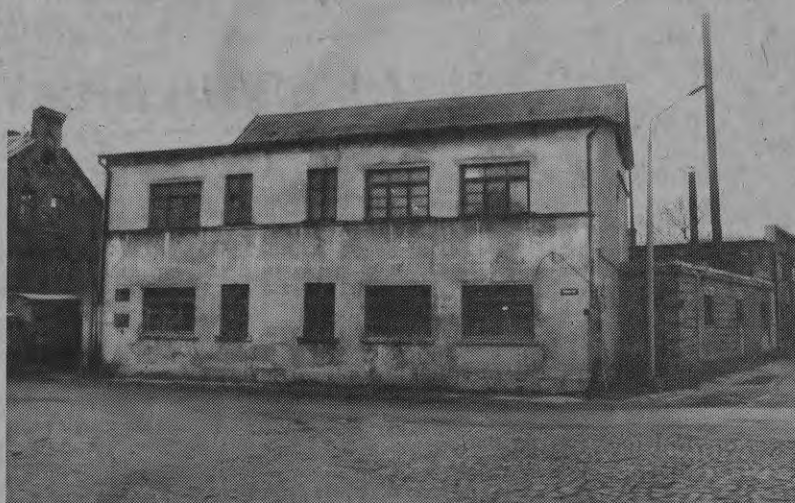
(Окончание. Начало в № 179).

Это была небольшая прогулка в воспоминаниях. Елгава не может гордиться долгими годами расцвета, она была разрушена во второй мировой войне, в июле 1944 года.