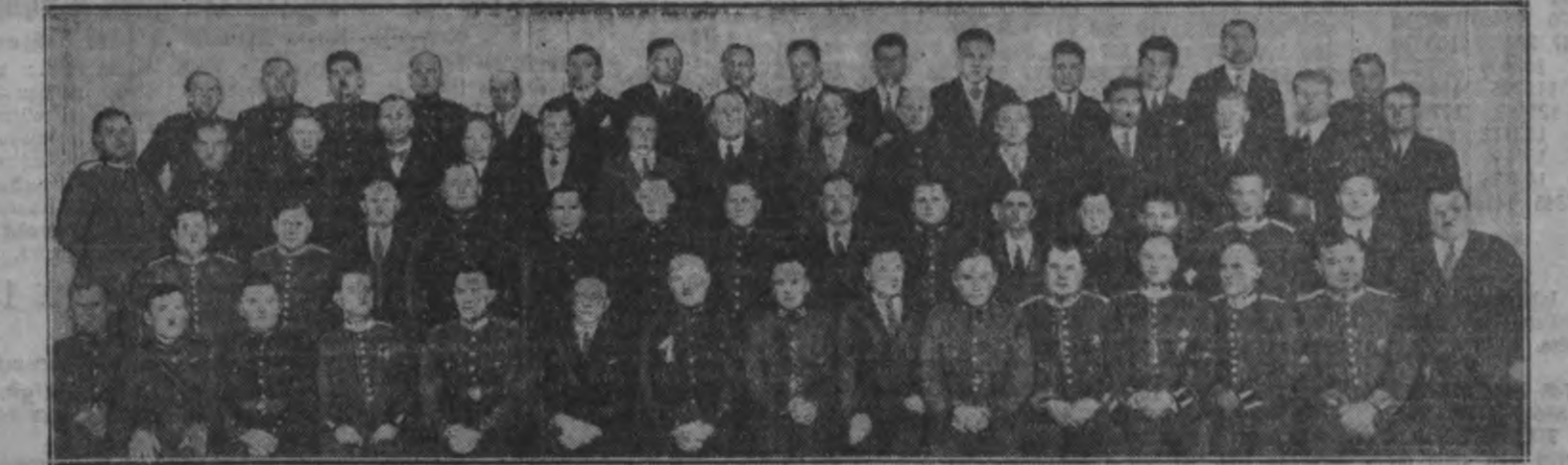
— Mēs jau vairākus reizes „Reģistrēti” esam apbrīnīti, ka mūsu valstī reālos strādā ne vien daudzi, materiāli pilnīgi nodrošināti eeredņi...