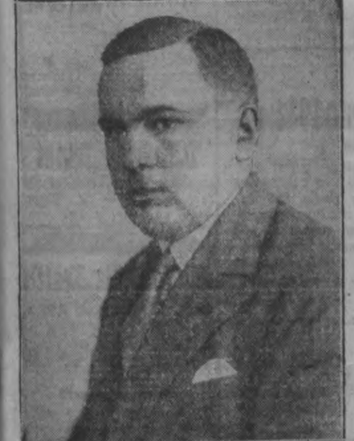
— Mēs jau vairākus reizes „Reģistrēti” esam apbrīnīti, ka mūsu valstī reālos strādā ne vien daudzi, materiāli pilnīgi nodrošināti eeredņi...