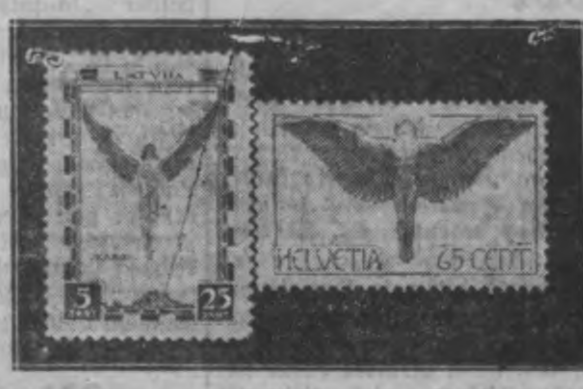
Pa kreisi — Latvijas lidotāju 5/25 sant. poštmarka, pa labi — Šveices 65 centu gaiss marka.