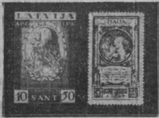
Pa kreisi — Latvijas lidotāju fonda 10 sant. poštmarka, pa labi — Itālijas gaiss paša marša ar Leonardo da Vinči galvu.