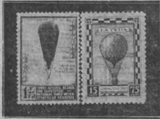
Pa kreisi — Beļģijas 1 kr. 75 sant. gaiss poštmarka; — pa labi — Latvijas 15/75 sant. lidotāju fonda marka.