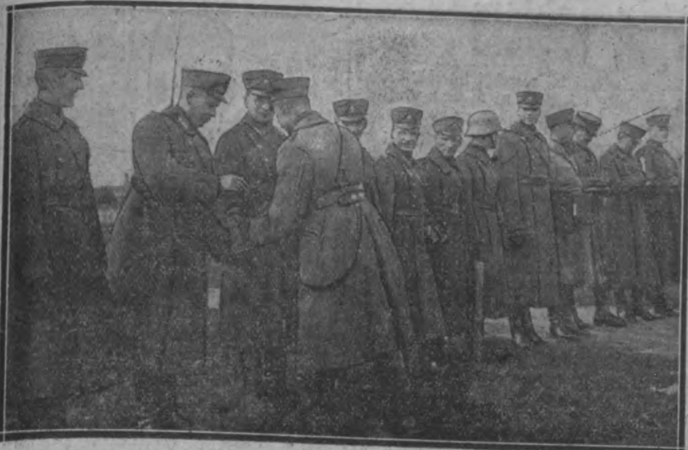
Virsnieku apbalvošana. 5. Behu pulka.