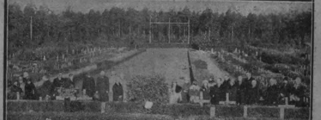
Leetawās āhrstī — eefshur sārūnī Wārshū lāpos.