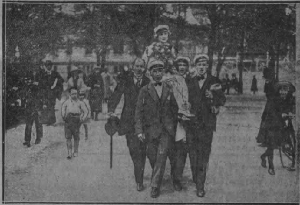
Jāntra študentū wārāshā Sūwēdrijā. Sūwēdrijā wēhl īfshālabajūfēes jāntra študentū wārāshā. Študentūs, kas īfshēghēshchī ābiturījās eefāwēem, wīwū kālēgī un kōlēgēs pūsh- kō sēedeem un nēhā īf rōfām āpshārtī pā wīshēhū.

pēe kārā īfrahjā Wāufkas aīfshārtū pūlkā māhītājās G. Zuefš, shtīnģēem wāhrdēem pēemīnot nēlāfā dārba preeku un pēenāshū- mā āpīnū. Wānāqū nolīfā aīfshārtū pūlkā wāhrdā un atwādījās no nēlāfā Wāufkas āpī. preefshchēeks A. Wēbers, eestadrona komandēera w. i. Strauchmāns, wēet. aīfshārtū nodālas preefshchēeks Sālmīnīsh un no Wēg- sārūles aīfshārtū nod. Šhīrtīnū eelāshchōt kār- pā, aīfshārtū 8 reīses sārūtejā.