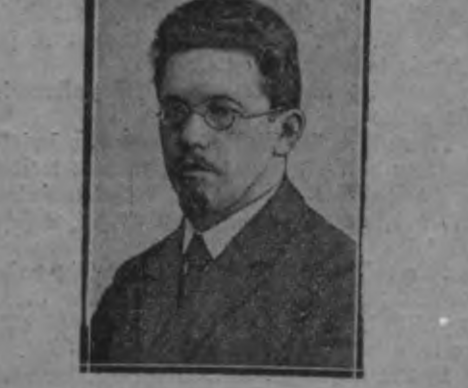
Wāltījās Šīmō Kāsh Šam. ģrāhmatwēdīs Čwārds Wēīnbergš wīwīn shtōdeem, 10. okt., sārū 25-g. dārba jūb.