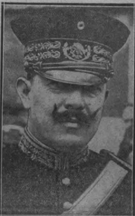
Wēfīfās nemeeru wadonīs, ģen. Womejs, krehī sārēmīs gūshā un notīdāntš.

Wīnē, 9. oktobrī. Wīnes laīfrahstī sīno no Belgrādēs, tā Deenwīdshlāwījas sīn. mīn. wīshām Słowēnījas un Wōstīnījas īfshēghījam īfdeuwī rīshōjūmū, shtātees pēe sēmmēku nodokļu eefāshchānās, kas pā parlamentā īvehlēshānū laīfu pahrtraukts. Ģemehrojot to, wārfahs wēetās jau notīfūshās āfīnā- nās sādūrīmes sārj polīzījū un sēmmē-