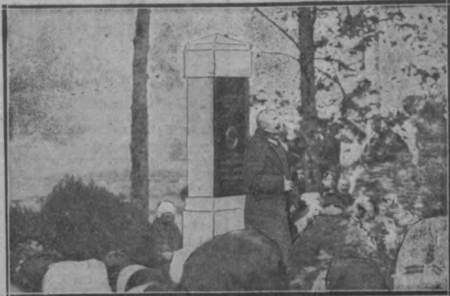
Wāljis preeidentā sēw. īfdeuwūmū eerebnīs ģen. Wīre atīlahjā wakar Sāifawā pēeminēhī atbhrīshwājēem.

Itā. Londonā, 8. okt. No Pekīnas sīno, la Shēnshī prōvīnzes aubernators Dēnshīshāns ējot telegrafīshī pēdahwājīs Tīshanghshōlinam meeru, bet īf īahdeem notīfumeem, lūkus Tīshanghshōlīns atīfatas pēenemt.