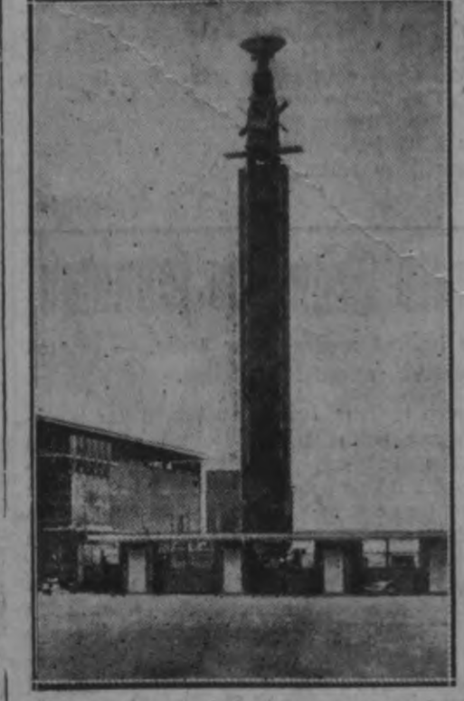
Maraton tornis, kura galotnē olimpisko spēļu atklāhānās deenā, 28. jūlijā, aīkvehđīs „Olimpisko uguni”.