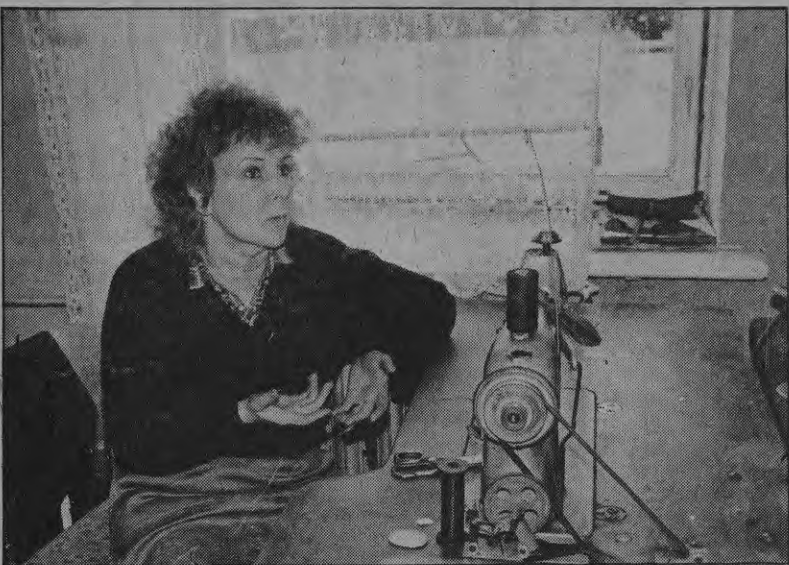
Сейчас происходит множество разных изменений. Есть они и в Элее... Намного больше обяза-

ностей у самоуправления. Элейское самоуправление перенимает в свое ведение собственность ком-