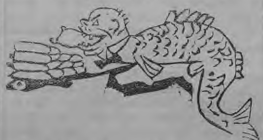
rija leelus kwantumus gan ahrfemes, gan eefchfemes labibās. Tagad tāš ir

Te ir ari loti praktifsti lauffaimneeki, kuri fina un mahf ismantot apstahklus un grahtos laifos pee naidinās tift. Schee zildenee, praktifsee wihri buhtu — Wilkens Zumbās, Spruntuls un Ralna Pihlens. Rād waldiba dewa loybaribu par weli, tad fchee ari nahza un pase-migi luhdā, lai teem ari dodot fahdu pudinu no waldibas ahbolina un feena, jo wimu nabaga lopini tifo turotees pee dshwibās. Raut gan tāš fchreibers Herr Schmidtu un tas pagafsta starfchins Jehrinfch ne bija wifai dewigi, tomehr tee jau nebija fātra fchuhni bijufchi un tadehi tee rizeja raudofcheem tehweem un dewa tift, zit likums atfahwa. Tee sawu teefu dabujušchi, wehderus ween aif preeca brauzija. Sebaroja firdsinus un eekrahwa wejumos sawu pahchu ahbo-