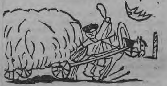
linu un feenu un tumfchā nafkt, dubseem fchfhtot, tā ftepeni, lai flauga azš to