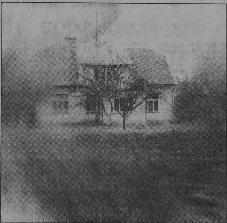
НА СНИМКЕ: В осенний день.