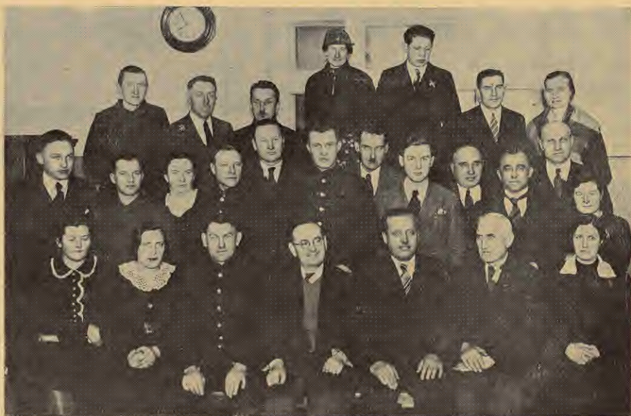
Vaiņodes p. t. k. palīgnod. pārzīņu kursu dalībnieki.

Savas darba gaitas sācis 1919. g., strādājot, kā viens no pirmajiem, pie telegrafa-telefona satiksmes atjaunošanas un uzbūves darbiem Bauskā un tās apkārtnē. No 1920. g. līdz šim laikam strādājis 3. telegrafa rajonā. 1923. g. ņēma dalību pie Bauskas telefona centrales izbūves un pārcelšanas no pasta uz telefona kantori. Viņam uzticētos dar-