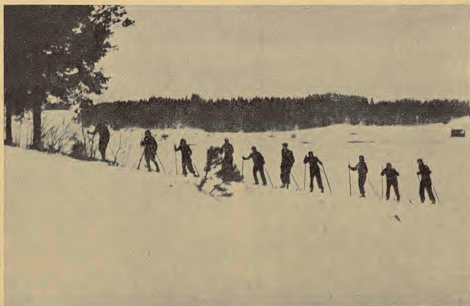
Jelgavas nodaļas slēpotāji pie Gauratu ezera.

II ligas basketbola meistarības izcīņā „P.-T. Sporta“ vienība š. g. 12. februārī sacenšoties ar Latvijas skautu centr. organizāciju (L. S. C. O.) vienību, pēdējo uzveica ar 37:20 rezultātu. Š. g. 29. janvārī „P.-T. Sports“ uzvarēja Dzelzceļu aizsargu sporta klubu ar 16:17 rezultātu. II ligas meistarības izcīņā „P.-T. Sportam“ vēl jāspēlē ar latvju-lietuviešu Apvienību un Amatieri. Sivākā cīņa paredzama ar Amatieri.