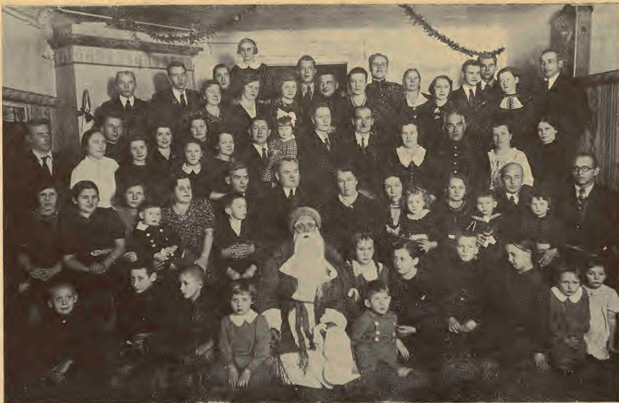
Tukuma nod. eglītes vakara dalībnieki.

ijas vienoto tehniķu biedrībā. Izpildīja apvienotās b-bas pirmā priekšnieka amatu līdz 1937. g. aprīlim, kad laika trūkuma dēļ atteicās, bet no š. g. janvāra atkal no jauna uzņēmās priekšnieka amatu.