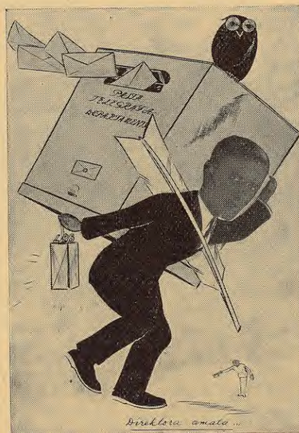
Žurnalista Priedes šaržs.