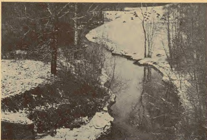
Pēc atkušņa.