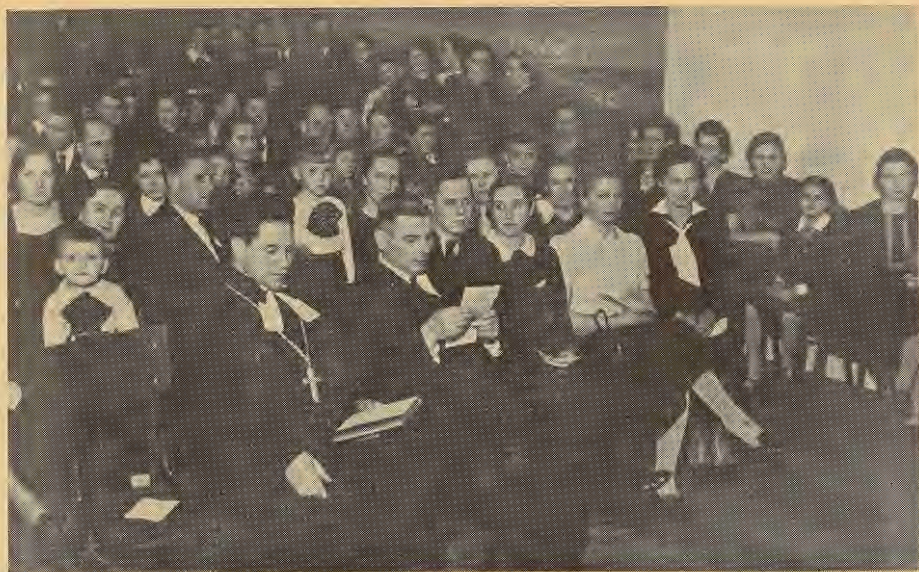
Jelgavas nodaļas eglītes vakara dalībnieki.

biedrības pilnvarnieku kongress ar plašākām svinībām, jo biedrība minētā laikā svin 10 gadu pastāvēšanu.