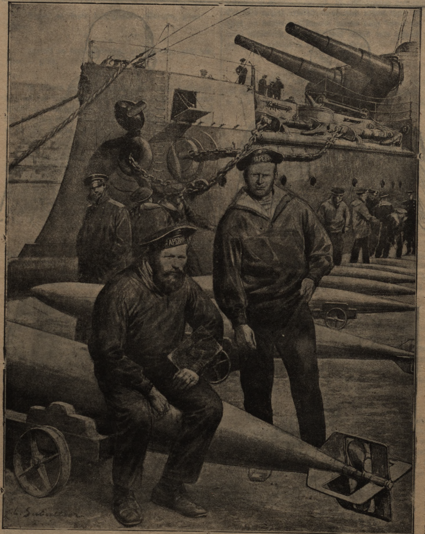
„Barewitscha“ matroschi eelahde minas.