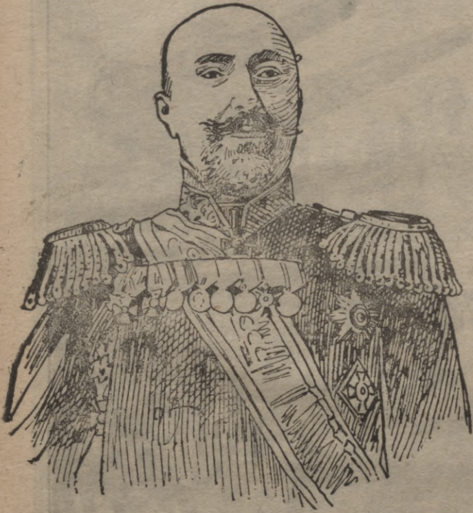
Admirals Stössels, Port - Arturas komandants