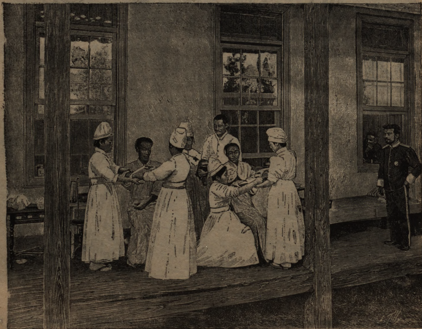
Japanu flinniza Tokijâ.

Atbildigais redaktors-lideneviss: O. Nahwitsch.