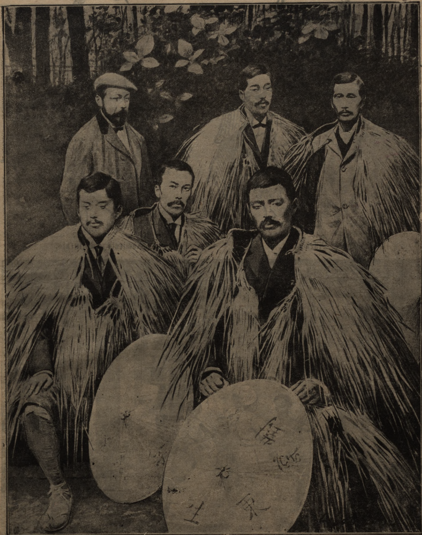
Japanu patriotiskās pretkreeru šabedribas lozekti.

Šis japonu šabedribas lozekti wirš eiropēšču brehbeu walkā japonu šemneku brehbes, kuras taištas no riņš šalmeem lohjās tee walkā sandales (vasiālas), bet galwā platas tautiškas žepures ar usrakstu: Pretkreeru šabedriba.