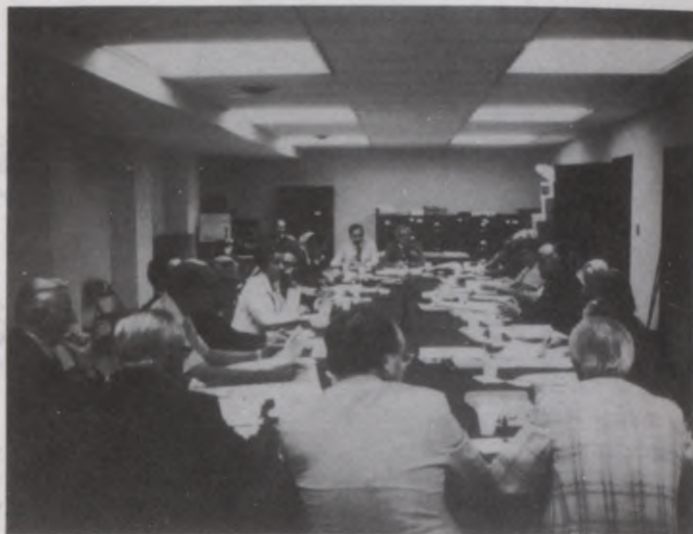
Uzņēmumā: ALA valde savā kārtējā sēdē Vaŗingtonā, D. C. 1977. g. 20. un 21. augustā.

Aizklātā balsoŗšanā no 10 par, 3 pret un vienam atturoties, ALA valde konstatē, ka Zinaīdas Lazdas Fonda Ziemeļkalifornijas nodaļai ir bijis galvenās valdes akcepts iestāties apvienībā un ka Kongresa rezolūcija izpildīta.