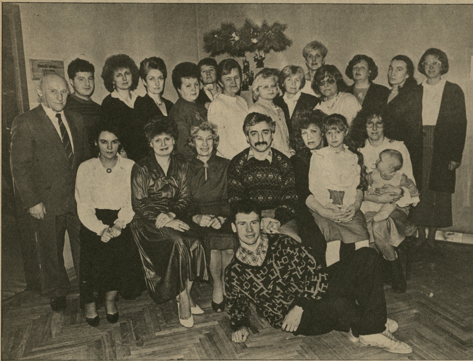
А это многие из тех, кто выпускает газету «Элга вас зинѣтайс».