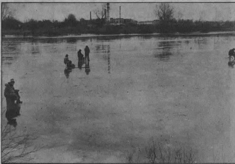
При решении продовольственной проблемы порой приходится рисковать и жизнью.