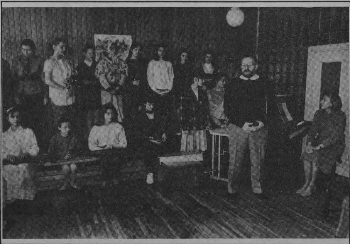
Школьный фольклорный ансамбль в данный момент слушает, о чем говорит в своей вступительной речи директор.