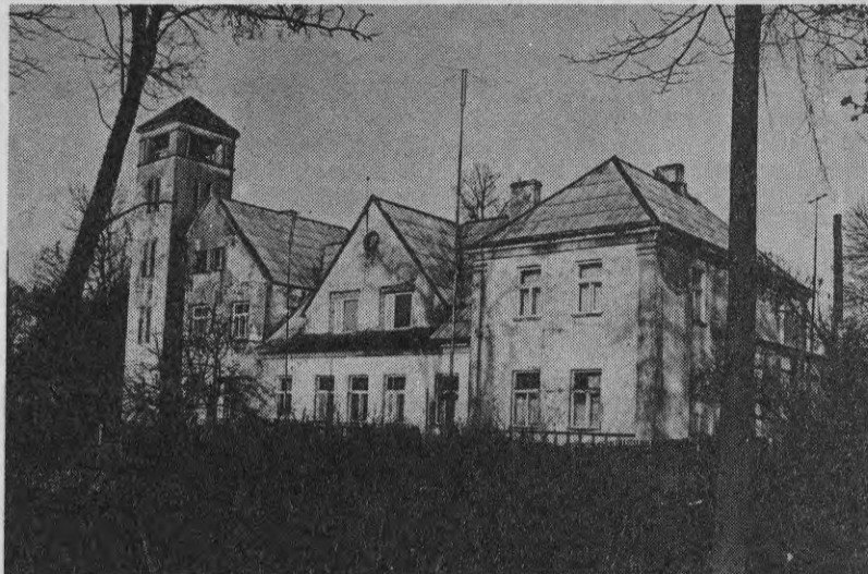
И со стороны Ласдуги видно, что сад превратился в неухоженный заросший двор