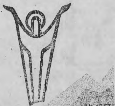
Svētīgi tē kalpi, kurus Kungs atnācis atrādīs nomodā

Да откликнемся всегда на призыв Христа "Будьте бдительны!" Пусть наша совесть, которая есть глас Божий, всегда помогает быть нам на страже. Приход Римско-католической церкви приглашает христиан всех вероисповеданий и всех елгавчан встретить вместе Пасху - весть о Воскресении