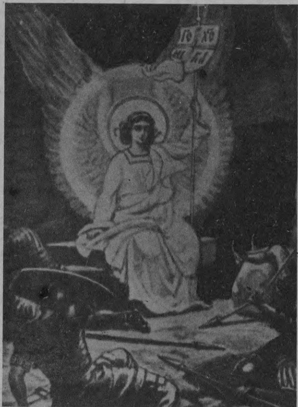
Подземный удар сотряс холм в пасхальную субботу. С грохотом отвалился камень от гроба, где был погребен Христос. Блеск, подобный молнии, бросил воин на землю. Явился Ангел. Гроб пуст...