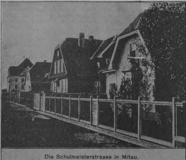
Die Schulmeisterstrasse in Mitau.