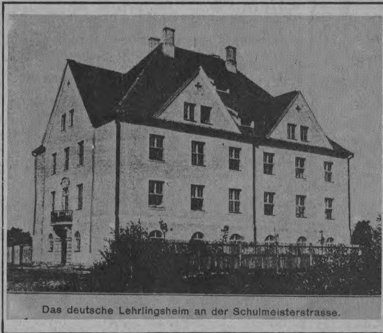
Das deutsche Lehrlingsheim an der Schulmeisterstrasse.

В Елгаве когда-то была немецкая средняя школа. Она пережила обе мировые войны и уничтожение Елгавы. Немцы уехали, а школа осталась. На снимке школа запечатлена такой, какой она выглядела в 1913 году. После второй мировой войны в здании размещалась средняя школа, позднее школьное здание горело. Его перестроили, и теперь от старого строения остались только декоративные украшения над входной дверью и над окном второго этажа. Теперь в неудачно перестроенном здании размещалась русская начальная школа.