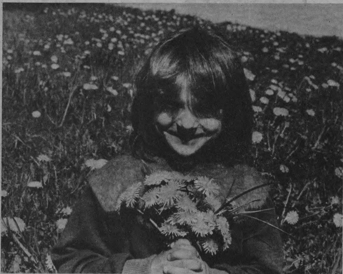
Пора цветения настала!

ЦЕНА по подписке 8 коп. розничная 15 коп.