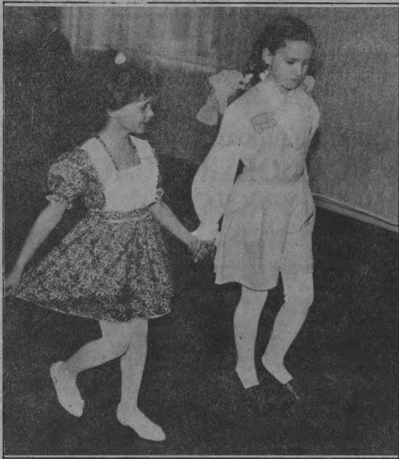
На снимках: модели слотра-конкурса. Разве не красиво?

Руководители егавских общеобразовательных школ собрались в школе ремесел, чтобы ознакомиться с этим учебным заведением, как одним из возможных мест дальнейшей учебы их воспитанников и поговорить о будущем ремесленного образования.